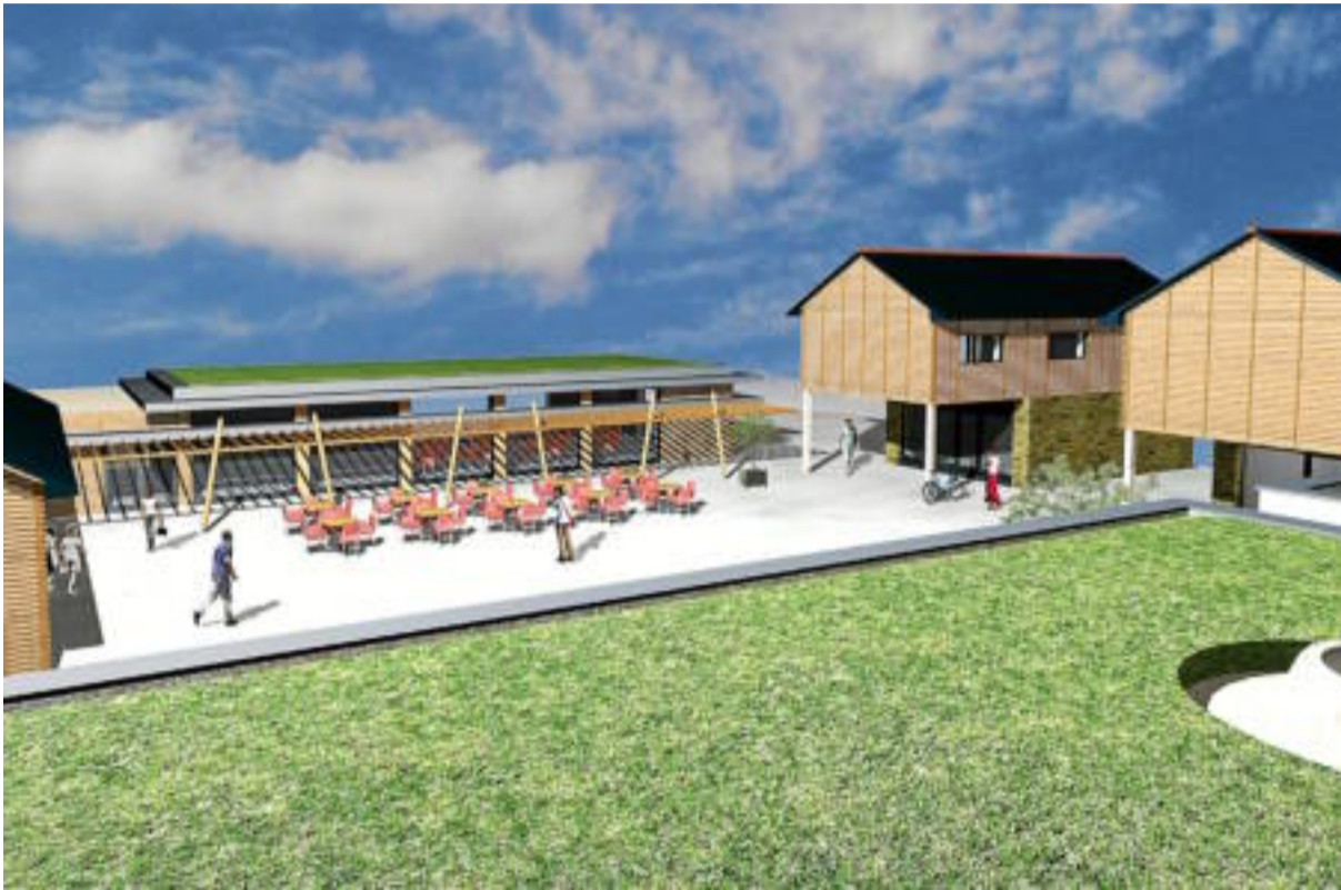
« Une empreinte écologique forte associée à une offre haut de gamme » : c'est le concept du club Paquana à Plélauff. C'est le cabinet A3A (Atelier Trois-Architectes) basé à Carhaix qui se charge de l'établissement du projet architectural.

Il n'y a pas d'équipement équivalent en Bretagne. Un projet de création de villages vacances grand standing est sur les rails à Plélauff.